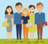
СТУДЕНТЫ КОЛЛЕДЖЕЙ, ПТУ, ИНСТИТУТОВ, УНИВЕРСИТЕТОВ, ОБУЧАЮЩИЕСЯ ПО ОЧНОЙ ФОРМЕ, А ТАКЖЕ ПОСЛЕВУЗОВОГО ОБРАЗОВАНИЯ