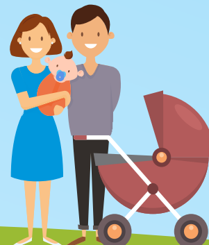
ЖҮКТІ ӘЙЕЛДЕР, БАЛА 3 ЖАСҚА ТОЛҒАНҒА ДЕЙІНГІ МЕРЗІМДЕ ДЕКРЕТТІК ДЕМАЛЫСТАҒЫ ТҰЛФАЛАР