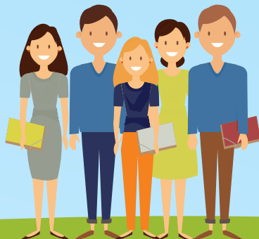
КОЛЛЕДЖ, КТУ, ИНСТИТУТ, УНИВЕРСИТЕТТЕРДЕ КҮНДІЗГІ БӨЛІМДЕ ОҚИТЫН СТУДЕНТТЕР