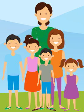
КӨП БАЛАЛЫ АНАЛАР «АЛТЫН АЛҚА», «КҮМІС АЛҚА»