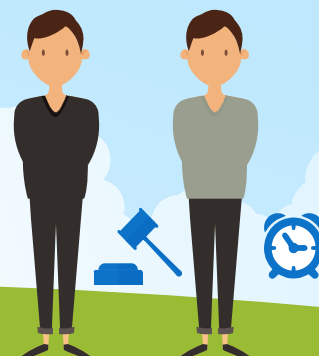
СОТ ҮКІМІМЕН ЖАЗАСЫН ӨТЕЙТІН ТҰЛФАЛАР УАҚЫТША ҚАМАУ ЖӘНЕ ТЕРГЕУ ИЗОЛЯТОРЫНДА ОТЫРҒАН ТҰЛФАЛАР