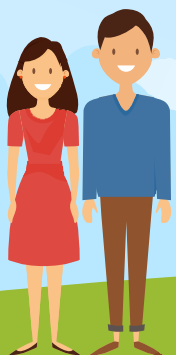
ЖҰМЫССЫЗ РЕТІНДЕ ТІРКЕЛГЕН ТҰЛФАЛАР